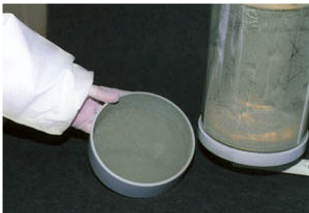
Esporos de Metarhizium anisopliae no compartimento de coleta

O equipamento consiste de uma câmara onde se faz a separação dos esporos do substrato sólido usando um leito fluidizado, e um ciclone duplo faz a separação e a classificação das partículas extraídas de acordo com o tamanho das mesmas. O produto final de esporos de fungos é facilmente coletado em um compartimento localizado na base do ciclone.