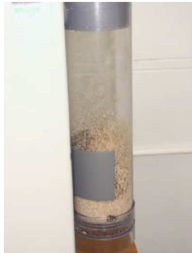
Leito fluidizado de grãos de arroz na câmara de separação